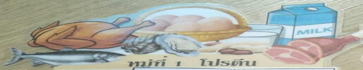
หมู่ที่ 1 โปรตีน