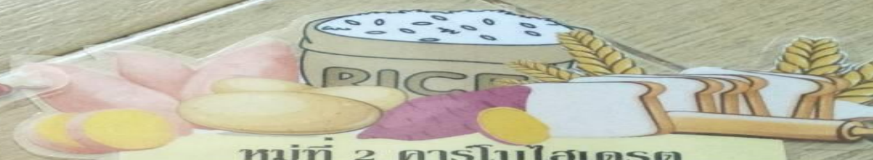
หมู่ที่ 2 คาร์โบไฮเดรต