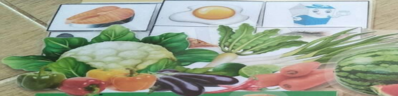
หมู่ที่ 3 เกลือแร่